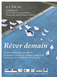
Affiche de l'exposition 2018

Exposition contemporaine d'œuvres artistiques créées par les élèves de deux classes du collège Condorcet, autour de l'anamorphose et du patrimoine local. Avec l'aide de l'artiste Florence Garrabé et dans le cadre des cours d'arts plastiques, de mathématiques et de français. Soutenu par le PETR & la Mairie de Nailloux.